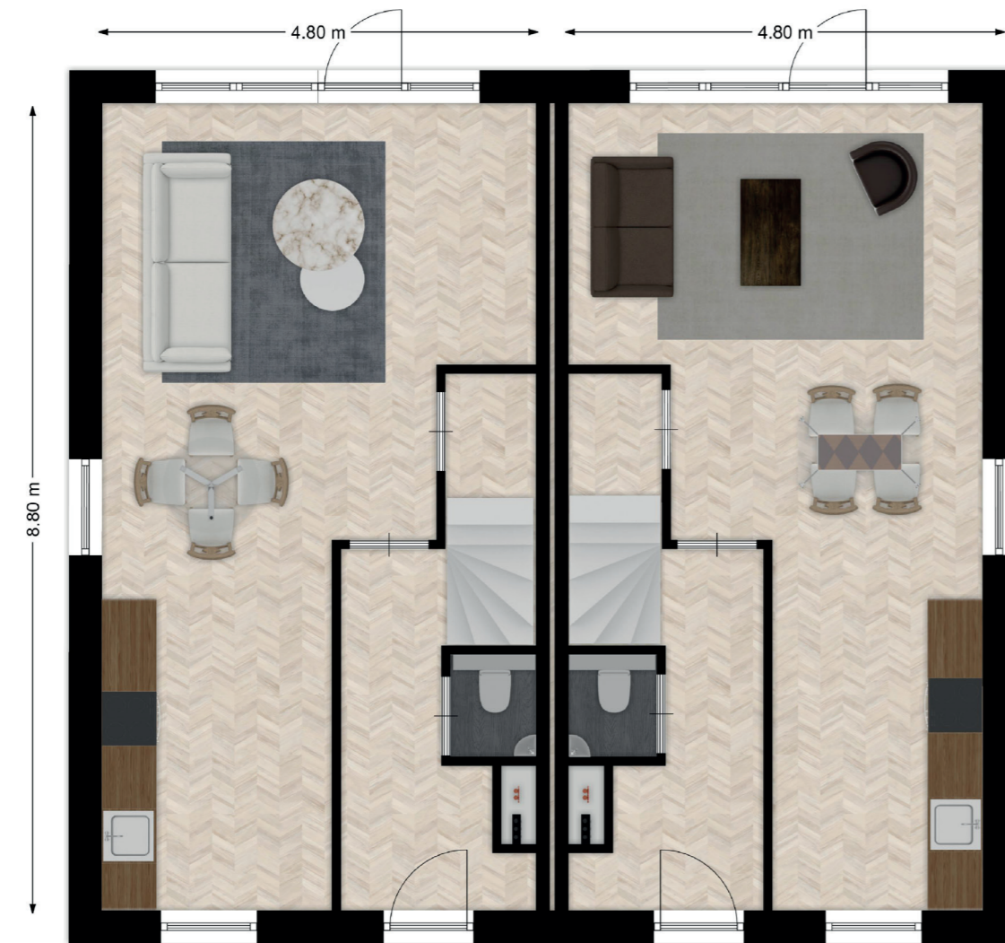
BNR. 04 EN 06