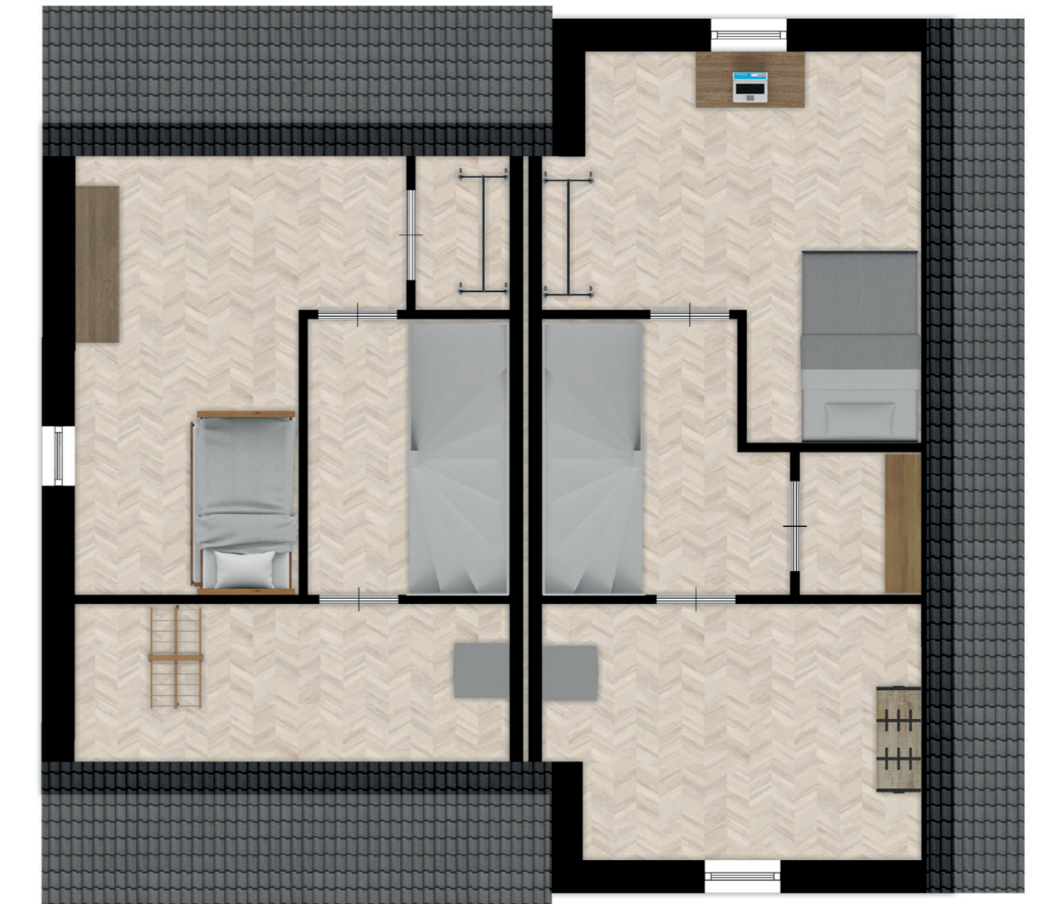
BOUWNR 04 EN 05