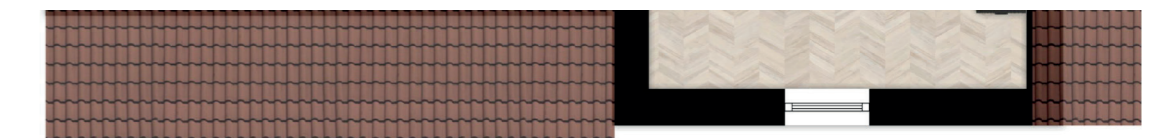
BOUWNR 06 EN 07

BNR. 04, 05, 06 EN 07 3-LAAGS TWEE-ONDER-EEN-KAPWONINGEN WOONOPPERVLAK: 109 – 113 M 2 PERCELOPPERVLAK: 192 – 200 M 2