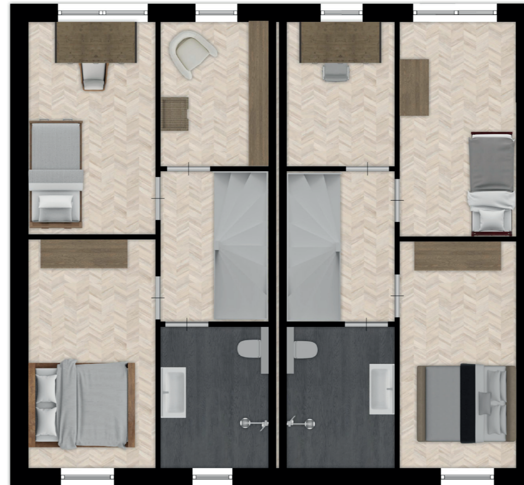
BNR. 04 EN 06