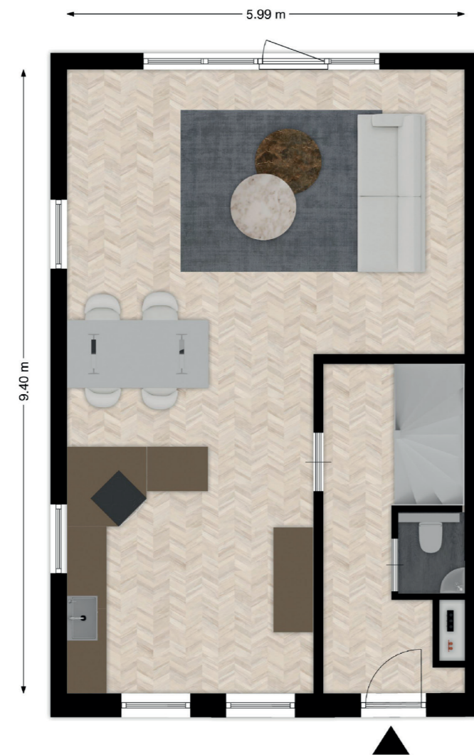
BNR. 01, 02 EN 03