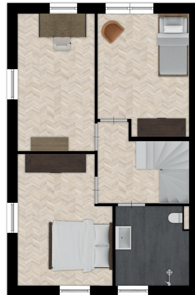
BNR. 01, 02 EN 03